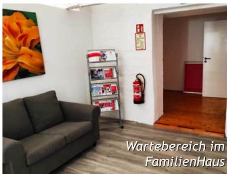
Wartebereich im FamilienHaus