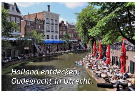
Holland entdecken: Oudegracht in Utrecht.

Das Reiseteam musste lange in den Startlöchern hocken und abwarten. Für jeden Monat hatten sie eine Fahrt vorbereitet (vgl. Flyer "Touren 2021"), wegen der Pandemie fiel Alles aus. Endlich geht es wieder los. Die Reiselustigen der AWO gehen wieder auf Tour. Was wann stattfindet, erfahrt Ihr auf der Homepage: www.awo-ahrensburg.de